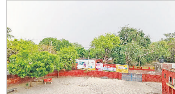
जींद। तेज आंधी के दौरान आसमान में छाई काली घटाएं।

पश्चिम विक्षोभ की सक्रियता से मौसम में बदलाव आ रहा है। गुरुवार दोपहर को अचानक से धूल भरी आंधी चली और कुछ समय के लिए हलकी बूदाबांदी भी हुई। जिसने गर्मी से राहत दिलाने का काम किया। तापमान में भी गिरावट दर्ज की गई। गुरुवार को अधिकतम तापमान दो डिग्री गिर कर 37 डिग्री पहुंच गया तथा न्यूनतम तापमान 23 डिग्री दर्ज किया गया। मौसम में आद्रता 42 प्रतिशत तथा हवा की गति 14 किलोमीटर प्रति घंटा दर्ज की गई। मौसम विभाग के अनुसार