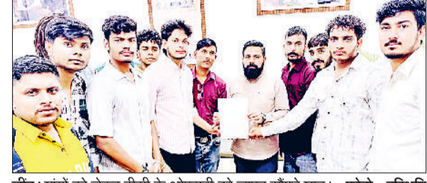
जाँदा। मांगों को लेकर वीसी के ओएसडी को ज्ञापन सौंपते छात्र।