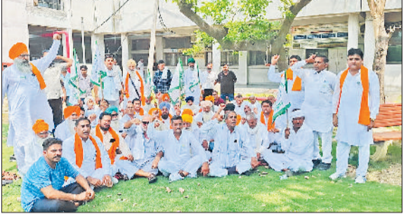
कैथल। अपनी मांगों को लेकर ज्ञापन सौंपते भाकियू नेता व धरना देकर नारेबाजी करते किसान।