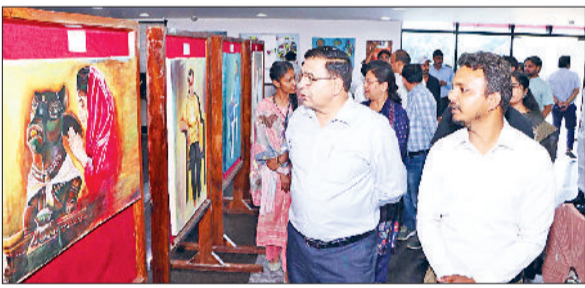
जाँदा। प्रदर्शनी का अवलोकन करते हुए वीसी।